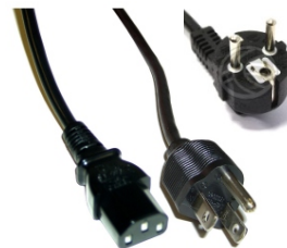
ALIMENTADOR POE 100 A 220 Vca CON CONEXIÓN DE CLAVIJA AMERICANA O EUROPEA

Fabrica y Servicio Técnico en España, Calle Agua Nº 1, Leganés 28918, Madrid, España, Telf. 902141402